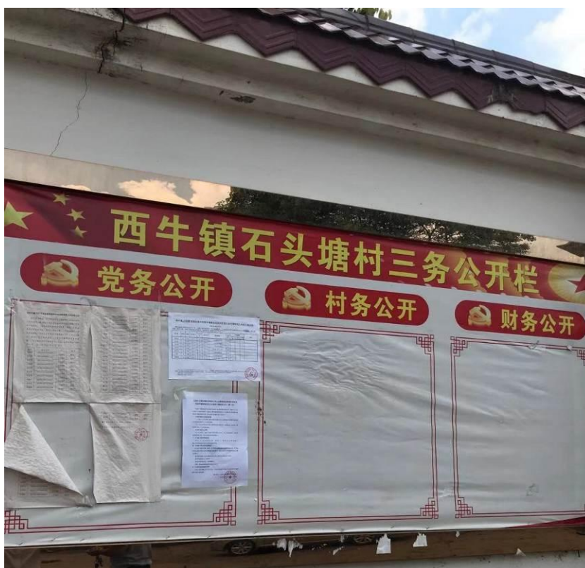
图 3-8 第二次环境信息现场公示（石头塘村）