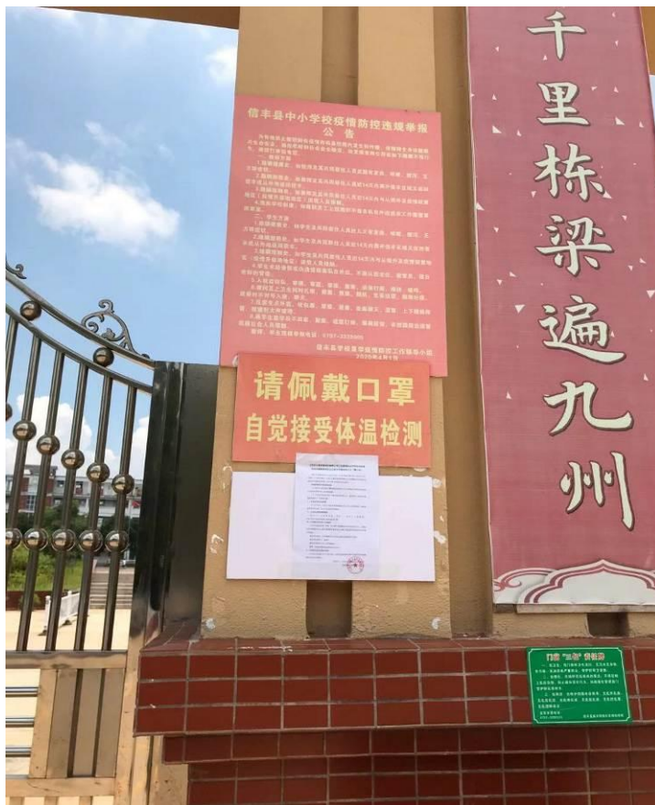
图 3-6 第二次环境信息现场公示（信丰工业园学校）