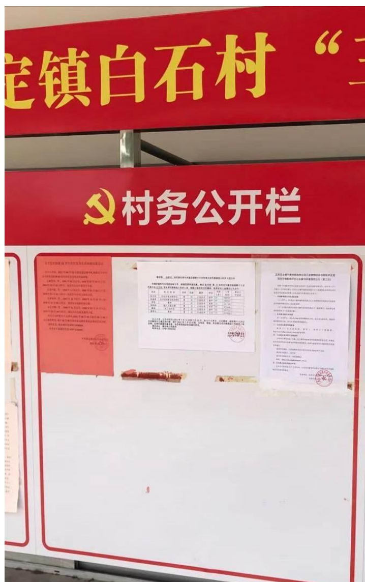
图 3-7 第二次环境信息现场公示（白石村）