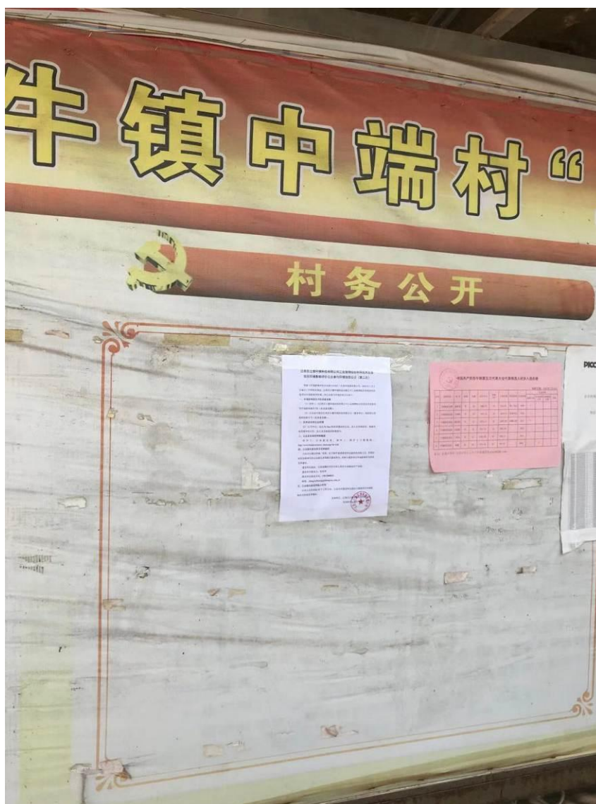
图 3-4 第二次环境信息现场公示（中端村）