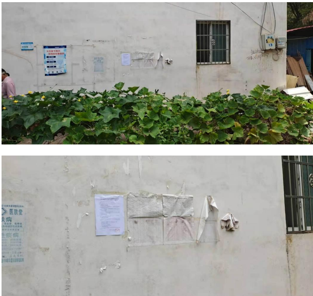
图 3-10 第二次环境信息现场公示（土背上）