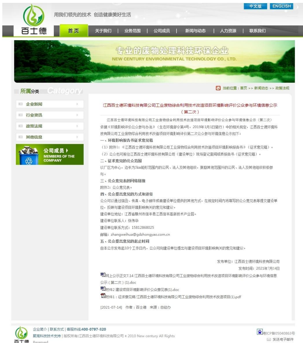
图 3-1 第二次环境信息公示（江西百士德环境科技有限公司网站）