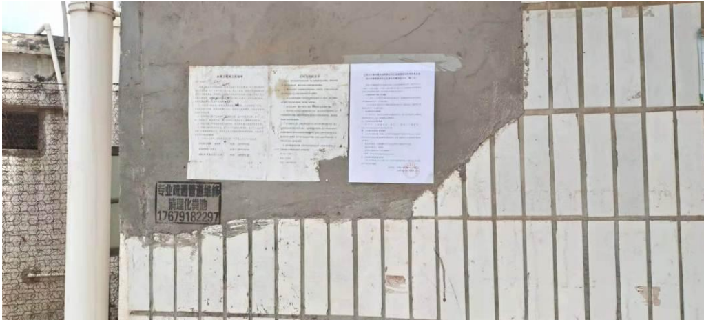
图 3-9 第二次环境信息现场公示（窑前）