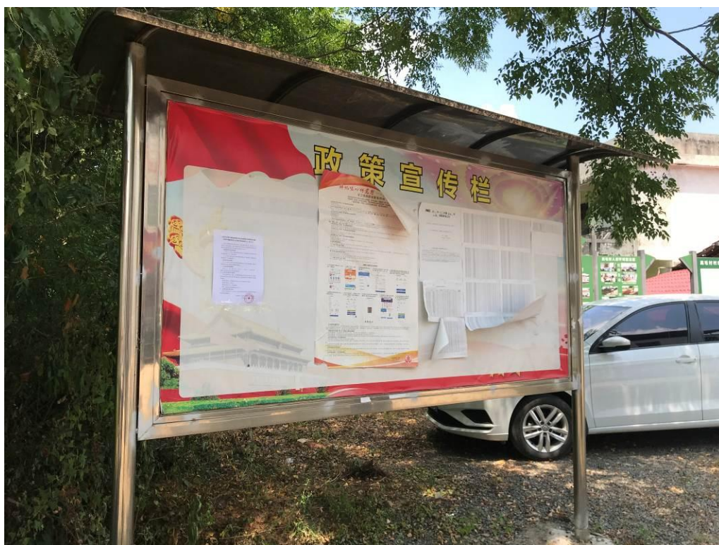
图 3-5 第二次环境信息现场公示（高坵村）